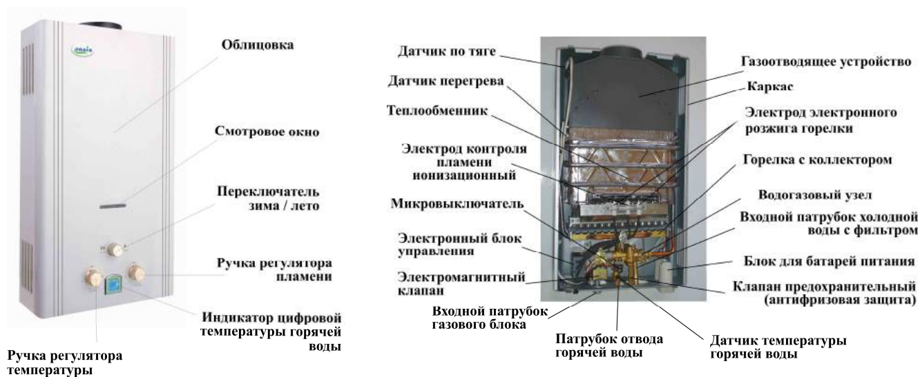
Рис.1. Устройство газового проточного водонагревателя «Oasis»

Составные части изделия, поясняющие принцип устройства аппарата и требующие технического обслуживания во время эксплуатации, показаны на рис. 1.